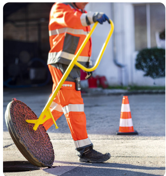
Nouvel outil lève-plaque

Des collaborateurs ont bénéficié d'une formation en lien avec la Santé et la Sécurité en 2025