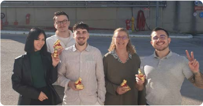
Chocolats de Pâques - Agence de Toulon (83)