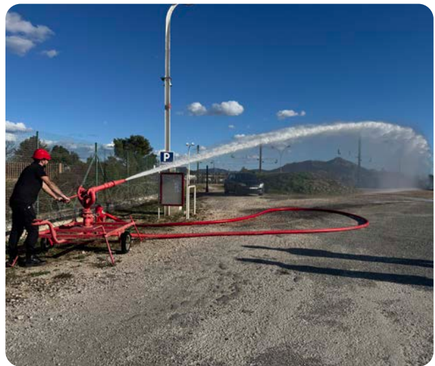
Manoeuvre d'entraînement à la sécurité incendie sur notre dépôt pétrolier de Toulon