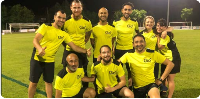
Tournoi de foot - Agence de Lons-le-Saunier (39)