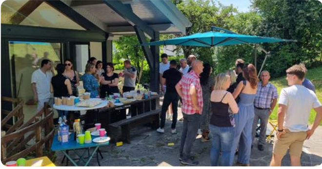
Repas d'été - Agence de Baume-les-Dames (25)