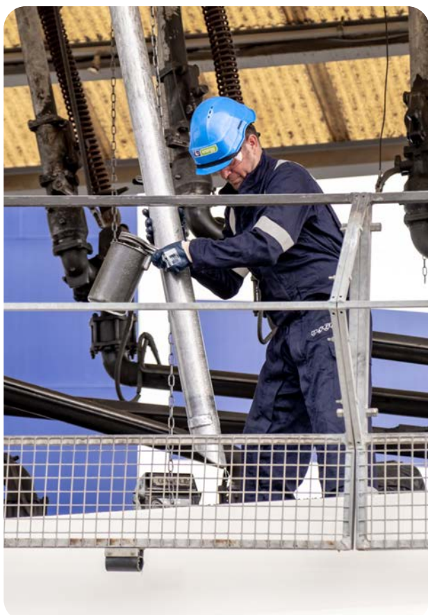
Conducteur remplissant son camion dans notre dépôt de La Garde