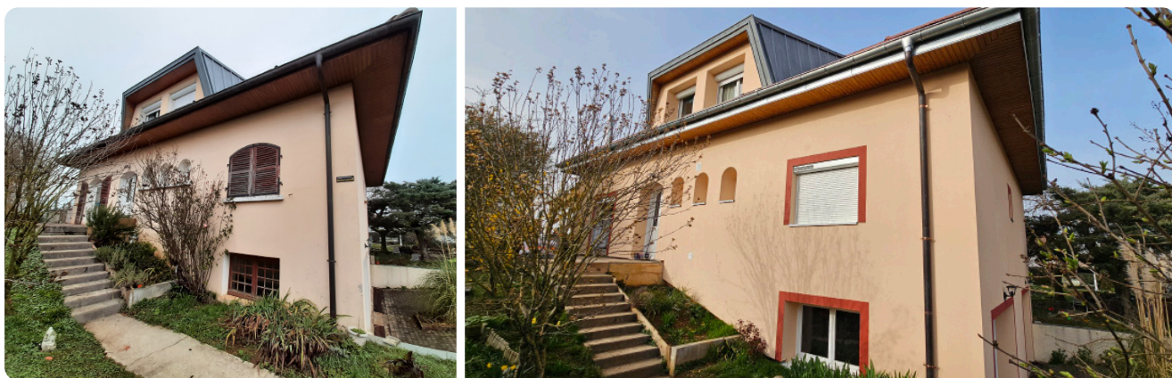
Avant/après d'un chantier de rénovation énergétique